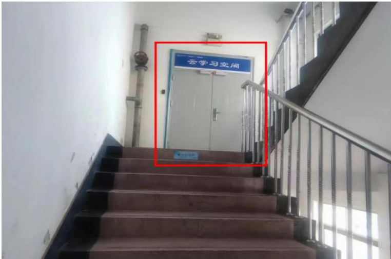
图四：为避免拥挤，考生可以在4楼缓冲区等待入场