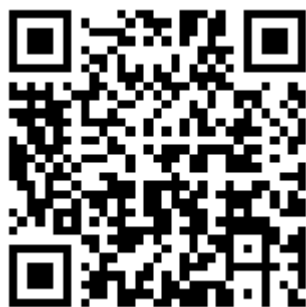
2023 年春季学期电子课程手册